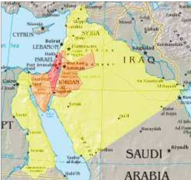
Les trois possibilités sur la taille d'Israël : - Le « Grand Israël » du Nil à l'Euphrate, selon la Bible - La taille proposée par le Traité de Balfour , englobant l'actuelle Jordanie, et défendue par Jabotinski - Les frontières actuelles

Jabotinsky ne rejette pas la coopération avec le Royaume-Uni : il souhaite son aide pour créer cette «Muraille d'acier». Il ne rejette pas non plus un accord avec les Arabes. On peut au contraire discuter avec eux « d'une garantie contre l'expulsion, de l'égalité des droits. Je crois et j'espère que nous pourrions leur donner ces garanties mais la muraille d'acier est le seul moyen d'y parvenir ». Vouloir bâtir un rapport de force sur le terrain n'est pas spécifique à Jabotinsky. Les Sionistes de toute obédience perçoivent l'immigration juive et la Haganah comme les outils de ce rapport de force.