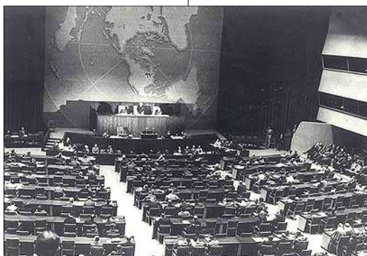
Le Conseil des Nations-Unies, en nov 1947

Ces versets consacrent le principe de la responsabilité personnelle et l'impossibilité de se venger sur un groupe de la faute commise par un autre.