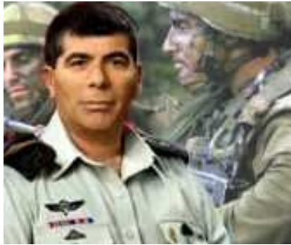
Gabi Ashkenazi, le 19ème commandant en chef de Tsahal

Si l'on doit admettre qu'Israël s'est laissé surprendre au Liban, les Écritures nous montrent clairement que le D.ieu d'Israël ne se laisse jamais surprendre ! Le Seigneur règne sur toutes choses, Il met les autorités en place et conduit les événements. A Lui soit la gloire !